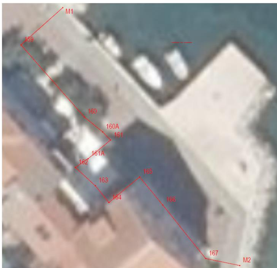
Slika 1. od spojne točke M1 do lomnih točaka 159 do 160