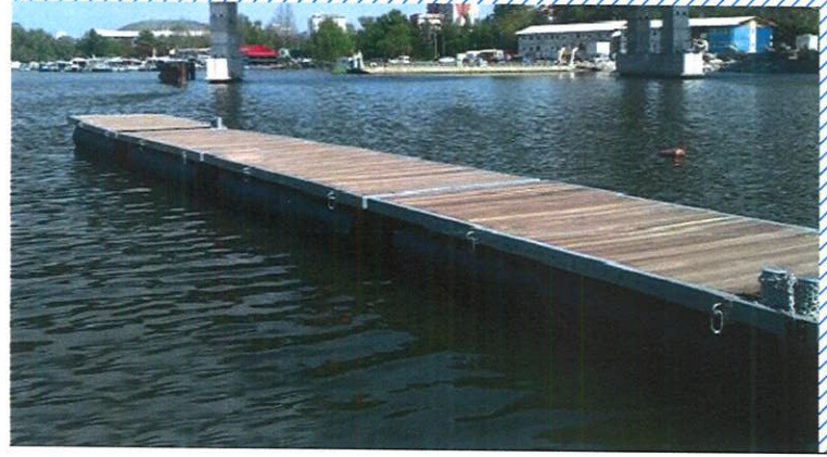
HOTEL ADRIA , BIOGRAD NA MORU_PRIJEDLOG PONTONA NA PLAŽI SOLINE vel.144m 2 (24x6m) + 50m 2 ( 15x3.3) | :500